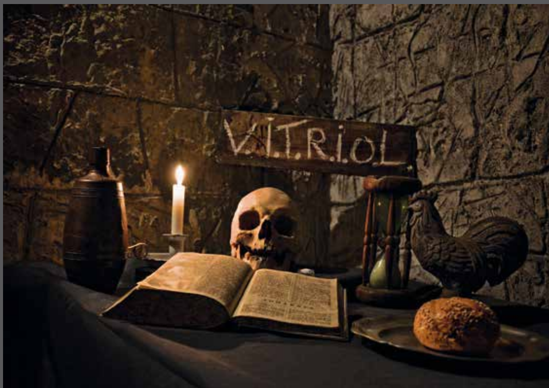
(Her)bezinning in de kamer van overdenking.